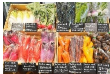
その日のテーマ野菜のほか、旬の野菜も並び選べるマルシェ

契約農家から産地直送した食育セミナーのテーマに沿った野菜を販売（または配布）。価格は企業との事前の打ち合わせで決めていて、1袋 50 円など手取りやすい福利厚生価格を設定。