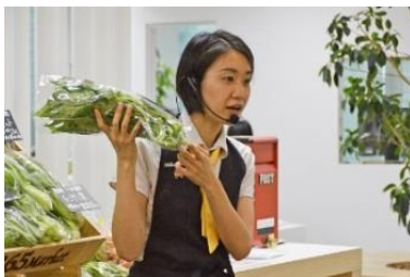
食のオタクである講師が野菜クイズや食べ方についてもレクチャー

月替わりの健康テーマに合わせ、野菜の見分け方、保存方法、調理の裏ワザなどをクイズ形式で楽しく参加型でレクチャー。“食のオタク”である野菜ソムリエや管理栄養士の資格保有者が講師。